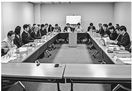
国交省検討会が活発に意見交換

改正入管法などが昨年6月に成立し、技能実習制度に代わって育成就労制度が令和9年度から施行されることになった。建設分野でも特定技能制度と連携を図りつつ外国人材が中長期的なキャリアを形成できる環境整備が求められている。特定技能制度では業務が①土木②建築③ライフライン・設備に区分され、在留資格は指導者の指示・監督下で作業に従事する1号、技能者