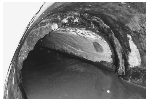
現場付近の下水道管内

流域下水道管理者に要請。延長約420kmの下水道管路に存在するマンホール約1700カ所