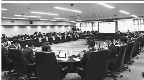
有識者がプレゼンテーション

小委員会がまとめた報告書を受け、また次期住生活基本計画の策定を見据え、人生100年時代における住生活の仕組みづくりについて活発な意見交換を繰り返した。マンションは国民の1