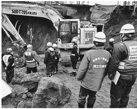
道路陥没地点の作業状況

八潮市の道路陥没事故は、下水道管の破損に起因すると考えられる。約120万人に洗濯や入浴による下水道の使用目えられ、トラックなどが巻き込まれた。今回の緊急点検は陥没場所と同様の大規模な下水道管路(処理水量1日30万m 3 以上の下水処理場現在、行方不明となつている。また、地域の住民