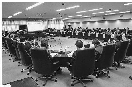
取り組みの方向性を確認

住生活基本計画(全国計画)は住生活基本法に基づき国民の住生活の安定確保・向上促進を図る基本的な指針。現行の計画は2021年に閣議決定され、DX(デジタルトランスフォーメーション)を活用した住宅の生