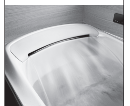
NEW システムバスルーム シンラ