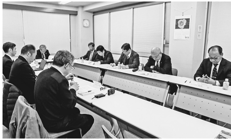
1年を振り返り新年に臨む

旧支援活動を展開した。今回の教訓を踏まえ、災害時の体制強化に努めたい。また10月に設備総合展を開催し、おかげさまで過去最大規模の来場となった。新年も業界への若者の入職促進や技術・技能の継承、メン