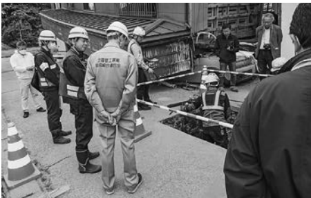
珠洲市での断水解消工事の様相

能登地方の断水は5月2日に能登町が全面復旧し、解消率は95%まで高まった。ただ8日現在、珠洲市は約1940戸、輪島市は約170戸と合計約3100戸で断水