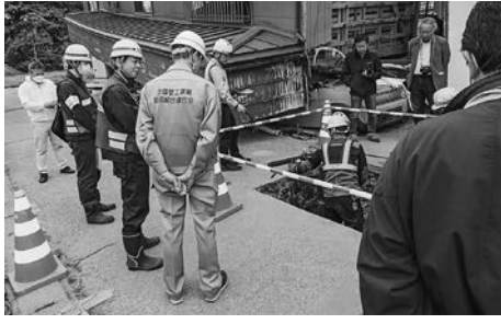
珠洲市での断水解消工事の様相