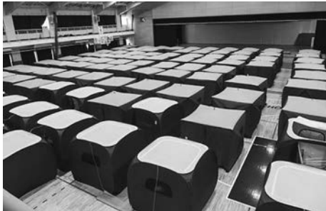
派遣組合は体育館のテントで宿泊