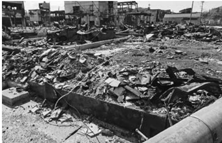
重大な被害を受けた輪島市