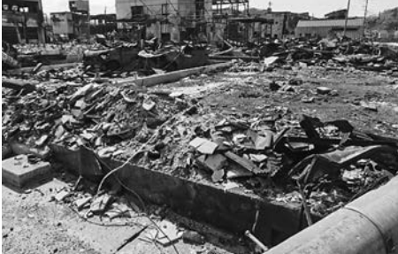
重大な被害を受けた輪島市