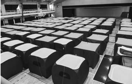
派遣組合は体育館のテントで宿泊