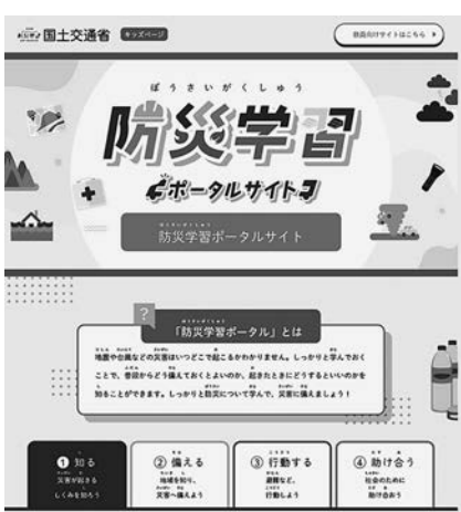
新サイトのトップページ

国土交通省は防災教育に役立つ情報・コンテンツをホームページ上で提供している防災学習ポータルサイトをリニューアルし、新たに「防災学習ポータルサイト」として公開した。新サイトでは子ども向けページを作成するとともに、ユーザーインターフェースの改良によって見やすさ・使いやすさを向上させている。防災学習ポータルサイトは学校や地域における水害などの防災教育を支援することを目的としている。とくに子どもたちが自発的に調べ、みずから学習することができるよう教材・素材の紹介文をわかりやすく記載。理科・社会・総合的な学習の時間などの授業で一段と活用されるよう期待している。ワンクリックで切り替え可能な従来の防災学習ポータルも教員向けサイトとして継続していく。