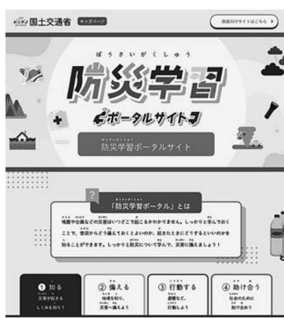
新サイトのトップページ

国土交通省は防災教育に役立つ情報・コンテンツをホームページ上で提供している防災学習ポータルサイトをリニューアルし、新たに「防災学習ポータルサイト」として公開した。新サイトでは子ども向けページを作成するとともに、ユーザーインターフェースの改良によって見やすさ・使いやすさを向上させている。防災学習ポータルサイトは学校や地域における水害などの防災教育を支援することを目的としており、子どもたちが主体的に調べ、みずから学習することができるよう教材・素材の紹介文をわかりやすく記載。理科・社会・総合的な学習の時間などの授業で二