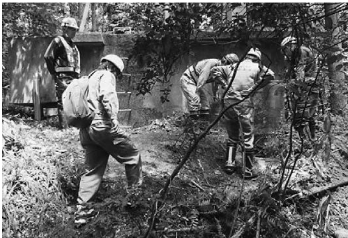
富山市協組の輪島市における復旧工事

また、ただ8日現在、珠洲市は約1940戸、輪島市は約170戸と合計約3100戸で断水が続いている。現地では給水車による応急給水活動を展開するとともに、浄水施設の修繕や水道管の漏水確認・修繕などに全力で取り組んでいる模様だ。 一方、石川県は輪島市、珠洲市、能登町、穴水町、七尾市、志賀町の能登6市町を対象に宅内配管修繕工事補助制度を新設。現住所の市町以外の工事業者による宅内配管・排水管修繕(自積り調査を含む)の掛かり増し経費(出張費)を補助する。受付窓口は石川県管工事業協同組合連合会事務局(フリーダイヤル012010551122)に設置した。受付時間は9:00~17:00(土日・祝日を除く)、受付期間は5月13日~7月31日となっている。全面復旧に一段と拍車がかかりそうだ。