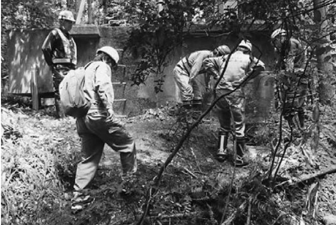
富山市協組の輪島市における復旧工事