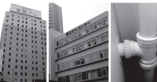
全国のホテル・病院・マンション等新築・改修工事に約1,000現場採用