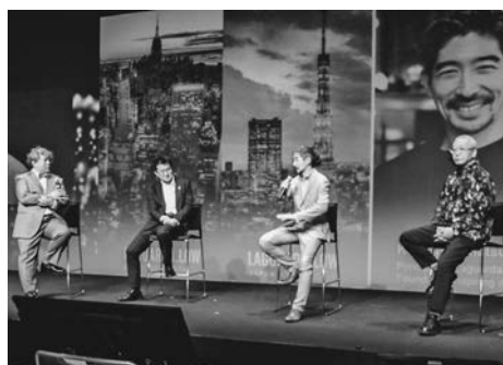
SNSも駆使してアピール

には約200名が来場。SNSも駆使し、ショートメッセージ投稿アプリケーションを使いながら全参加型スタイルで水辺活用の可能性を探った。ミズベリリングは安らぎのある水辺の価値を見つめ直し、身近なニューロネア(新天地)としての活用をめざす官民連携プロジェクト。名称は水辺とリング(輪)、リネーション、進行形LINGを組み合わせた