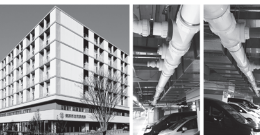
横浜市民病院内地下駐車場の天井配管(100A~300A)