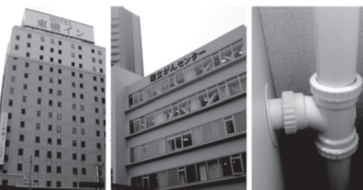
全国のホテル・病院・マンション等新築・改修工事に約1,000現場採用