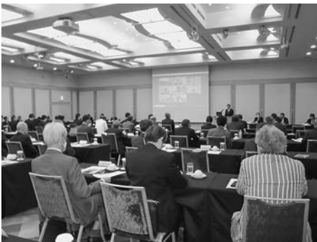
品川プリンスホテルで理事会