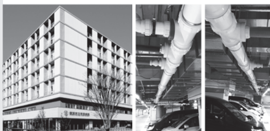
横浜市民市民病院地下駐車場の天井配管(100A~300A)