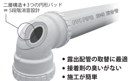
二層構造+3つの円形パッド = 5段階消音設計