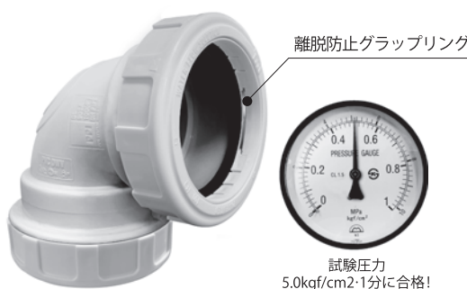
離脱防止グラブリング