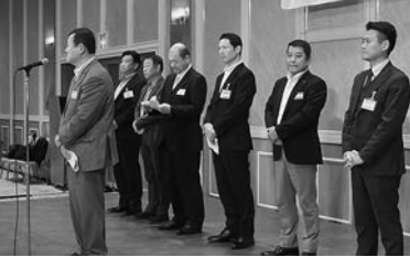
支部・青年部が活動報告