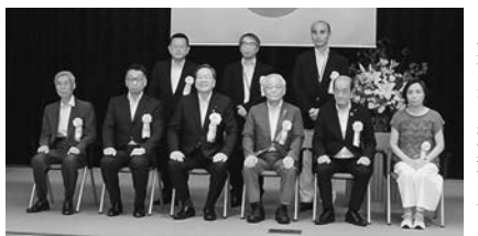
受賞者と斉藤国交相が記念撮影

国土交通省は8月4日、東京・霞が関の中央合同庁舎3号館で令和5年度水資源功績者表彰式を開催した。斉藤鉄夫国交相らが出席し、長年にわたって多大な貢献をした個人1名・4団体に表彰状を授与した。