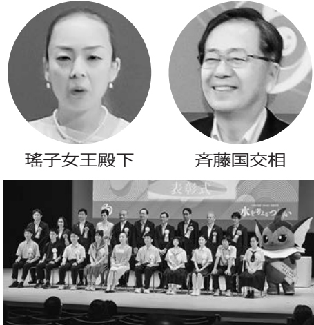
中学生作文コンクールで表彰式

8月1日の「水の日」は平成26年に制定された水循環基本法に基づき水の大切さなどの普及啓発を目的としている。毎年「水の週間」(8月1日〜7日)では国・地方公共団体・民間事業者・市民団体などが連携し、全国規模で多彩なイベントを展開している。