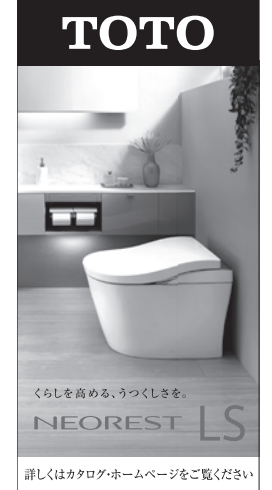
詳しくはカタログ・ホームページをご覧ください

発行所 (株)日本設備工業新聞社 東京都渋谷区桜丘町10-13 〒150-0031 野元第1ビル 電話 (03) 3496-4774(代) FAX (03) 3464-1884 info@setubikogyo.co.jp 年額8,800円(税込送料込)