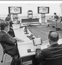
初会合で活発に意見交換

気候変動の影響などによる水害の激化・多発化に対し、国は流域すべての関係者が協働する流域治水の取り組みを進め