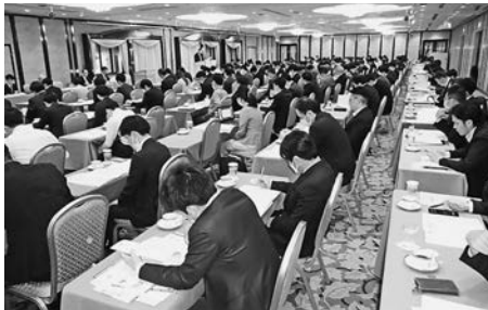
明治記念館に約190名参集