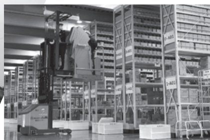
グループ拠点を結ぶ物流網