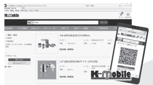
お客様向け発注管理システム「K-Mobile」