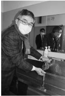
宮崎理事長(右)と南澤専務が協力して設置