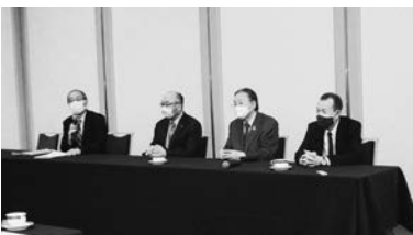
理事会後に記者会見