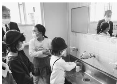
子供たちが笑顔で手洗い