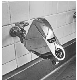
速やかに設置された自動水栓