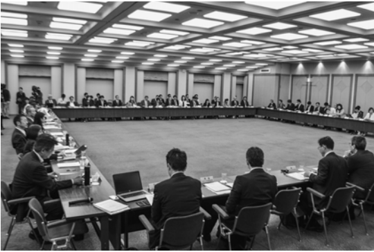
中環審部会と産構審小委が合同会合