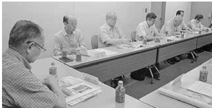
執行部役員が記者会見