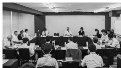
初会合で活発に意見交換

環境省は七月五日、東京・港区のTKP新橋カレッジ、中小企業・初心者向けに「環境報告ガイド」を公開した。第一回「環境報告ガイド」は、環境省が「環境報告ガイド」を公開した。第一回「環境報告ガイド」は、環境省が「環境報告ガイド」を公開した。第一回「環境報告ガイド」は、環境省が「環境報告ガイド」を公開した。