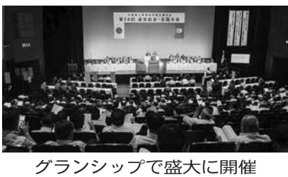
グランシップで盛大に開催