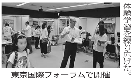
東京国際フォーラムで開催

水循環政策本部、国土交通省、東京都、水の週間実行委員会による水のワークショップ・展示会が八月十五〜十七日の三日間、千代田区の東京国際フォーラムで開かれ、水について学ぶ機会を多くの人に提供した。平成二十六年に施行された水循環基本法は国民が健全な水循環の重要性を認識し、水資源の持続可能な利用を図ることを目的として制定された。このため同ワークショップでは官民が一致協力し、夏休み中の小学生や保護者を対象に親しみやすい体験学習を繰り広げた。