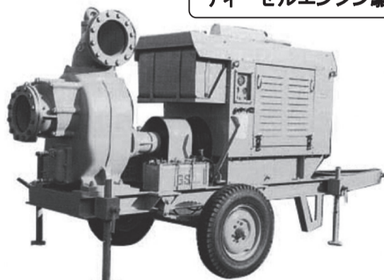
EP 据置式 2輪台車付 4輪台車付