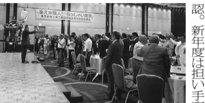
新たな決意を込めて乾杯

同協議会は次代を担う後継者を育成し、会員相互の親睦と親密な連携を目的に発足。全国規模の活動を推進・強化し、現在では三十一団体・会員数約千六百名まで成長した。