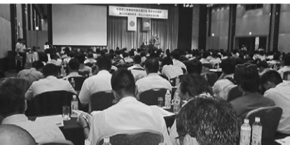
京王プラザホテルに400名集う